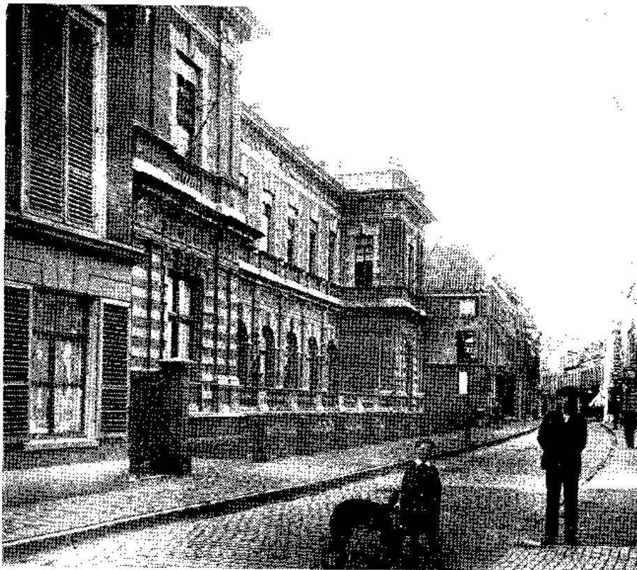
Het nieuwe sociëteitsgebouw in de Koningstraat, dat op 11 maart 1878 betrokken werd en omstreeks juli 1945 werd verlaten.